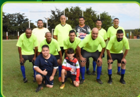
DIVA MÓVEIS / IMPERADOR DOS SONHOS

Fazenda Santa Teresa / Rafael Auto Center / Lazim Center Motos / Js Tornearia / Wladimir Bombas / Thielo Barbearia / Açougue e Linguçaria Artesanal / Supermercado Ana Carla / Constru Lourenço / P e C Funilaria / Casas das Coxinhas.