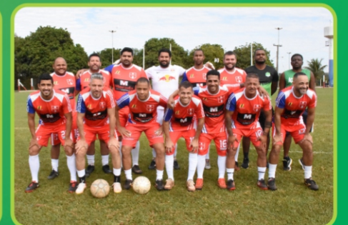
WD Contabilidade / Studio Doug Fanny / Amigos do Raphael Silverio / Track Cana / Tecseg Segurança Eletrônica e Automação / Casa da Grama