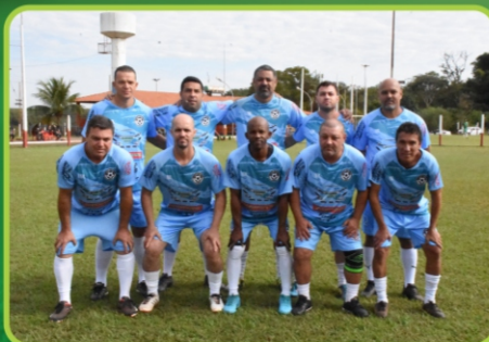
Ricardinho Veículos / Piska Auto Center / DM Caçambas / MD Pizza's / Óticas OR.