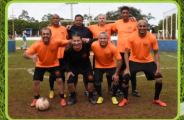
DM CAÇAMBAS F.C

O Campeonato de Futebol de Campo Categoria 35 anos, teve início no Domingo dia 11 de Junho. Seis equipes participam da competição. A previsão da grande final é dia 21/07 (sexta-feira).