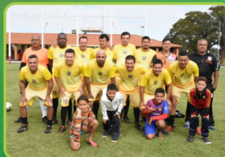
Amigos do Gil / Lubrificante & Cia / MD Pizza's / Zé Auto Elétrica