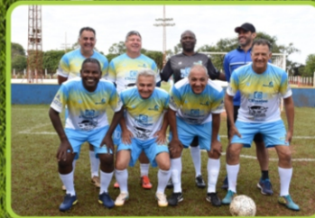
MESSIAS PISCINAS / AUDITA PERÍCIAS CONTÁBEIS & FINANCEIRAS / WD CONTABILIDADE / CIRINO & CIRINO MATERIAIS ELÉTRICOS / PIRIA DE SMANCHE DE VEÍCULOS