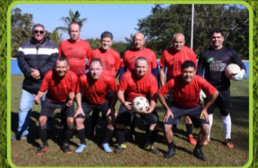
BUFFET COQUEIRO / BARMAC ALBERTO MOREIRA