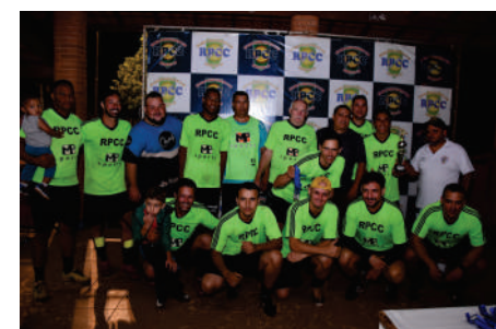
EQUIPE VICE-CAMPEÃ VERDE CLARO