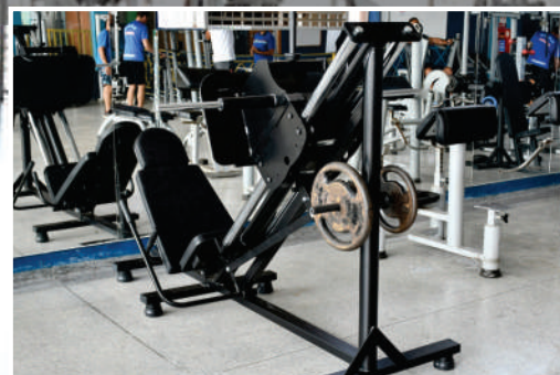
Leg Press 45