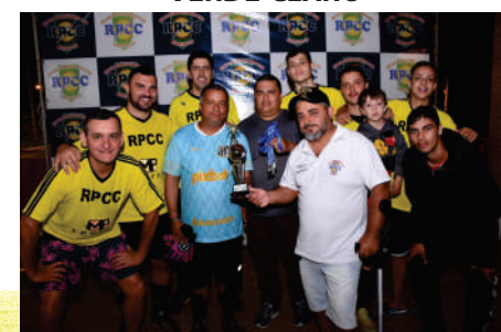
4º LUGAR EQUIPE AMARELA