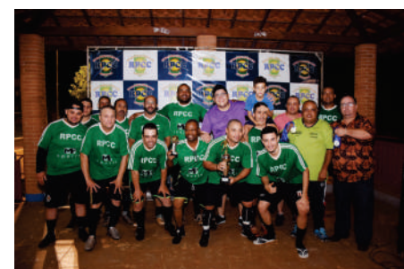
EQUIPE CAMPEÃ VERDE ESCURO