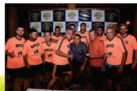
3º LUGAR EQUIPE FLUORESCENTE