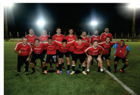
EQUIPE - VERMELHO