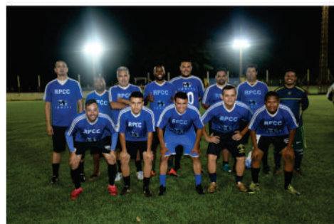
EQUIPE - AZUL ESCURO

O futebol de campo que uma das atividades mais exercidas no clube, com seus torneio e campeonatos, deu início a edição do CAMPEONATO DE RACHA 2021 no ultimo dia 20 de Outubro, com a presença de oito equipes, confira: