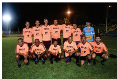
EQUIPE - LARANJA