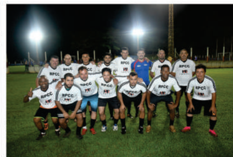
EQUIPE - BRANCA