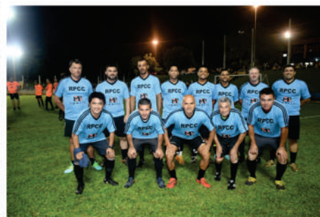
EQUIPE - AZUL CLARO