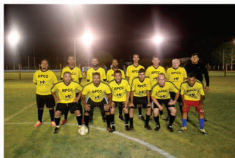
EQUIPE - AMARELO