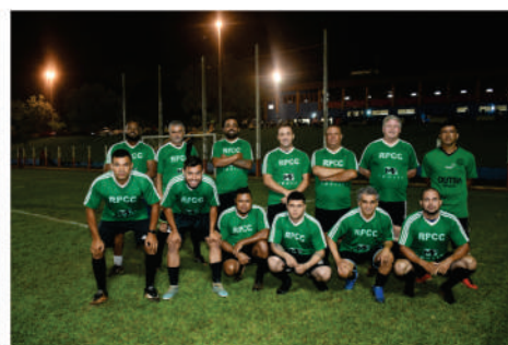
EQUIPE - VERDE ESCURO