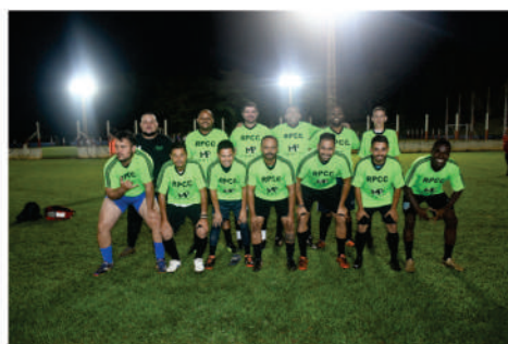
EQUIPE - VERDE CLARO