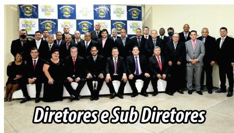
Diretores e Sub Diretores