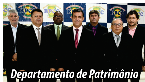
Departamento de Patrimônio