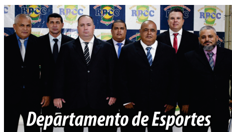
Departamento de Esportes