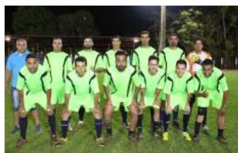
PSG / GLEDAN MATERIAIS P CONSTRUÇÃO / MAURICINHO ESCAPAMENTOS