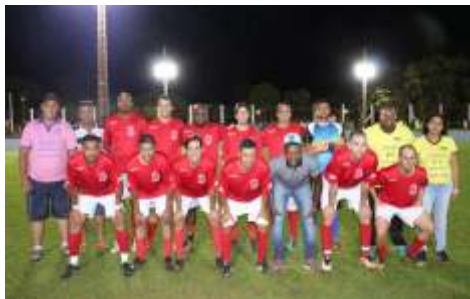
AMIGOS DA CRISTINA / MAURICINHO ESCAPAMENTO ASSISTEC / FARMÁCIA SÃO FRANCISCO