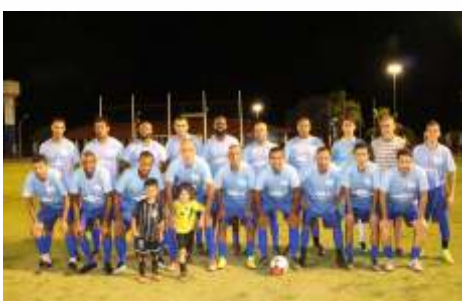
J.G AUTO CENTER / CIA DO ESPORTE / DIVA MOVEIS / CR7 GESSO / MOREIRA GÁS