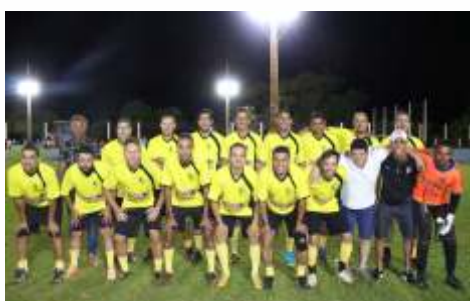
INTER JOCKEY / AMIGOS DO ROBERTO