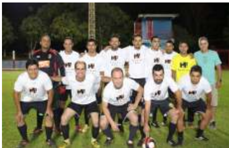
AMIGOS DO GUARANÁ / WRD BTOS