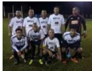
4º lugar - branca