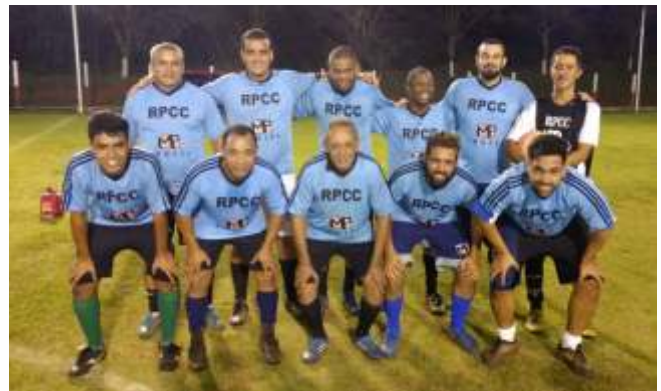
1º lugar - azul claro