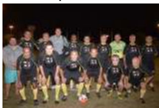
MP Sport's - Messias Piscinas