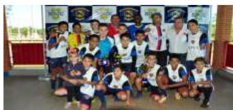
2º lugar - Rio das Pedras