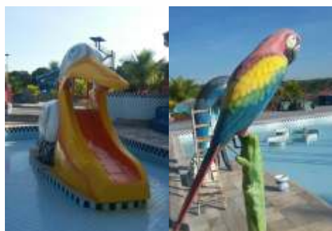
Pintura e manutenção da cascata e brinquedos das piscinas infantis.

Diariamente nossas equipes de manutenção, zeladoria, elétrica, hidráulica, jardinagem dentre outros colaboradores, trabalham para o perfeito funcionamento das nossas instalações. Nossa diretoria faz questão de acompanhar cada obra e conserto. Se informe sobre as melhorias mais recentes.