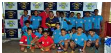
4º lugar - Escolinha do Zezinho