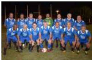
Buffet Coqueiro - Diva Móveis

Estão previstos cinco rodadas em turno e retorno. O Campeonato é formado por associados acima de 40 anos de idade e conta com cinco equipes.