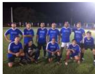
2º lugar - azul escuro