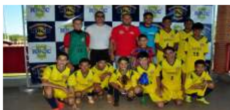
3º lugar - Colombia