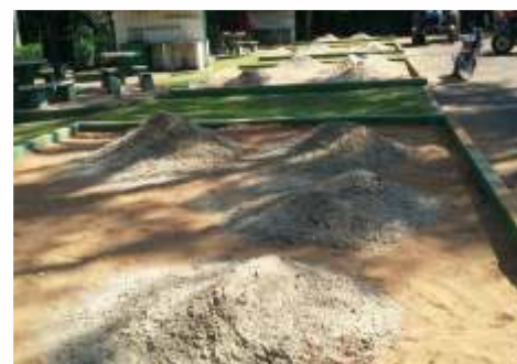
Troca da areia do camping