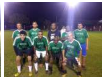
3º lugar - verde escuro