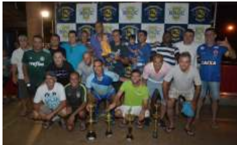
EQUIPE CAMPEÃ M.A. REFRIGERAÇÃO - MESSIAS PISCINAS