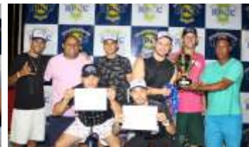
EQUIPE 3º COLOCADA - WD CONTABILIDADE/ CIA DO ESPORTE/ HOMERO/ AMIGOS DO RAPHAEL SILVÉRIO