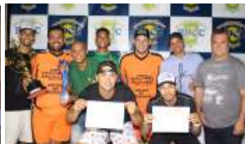
EQUIPE VICE CAMPEÃ - CIA DO ESPORTE/ DIVA MÓVEIS/ VIAÇÃO RIO GRANDE/ IMPERADOR DOS SONHOS