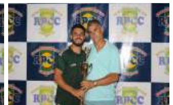
DESTAQUE - RENAN - OS PERIQUITOS/ PERSONAL /MP SPORT'S / SOPRANO CONTABILIDADE