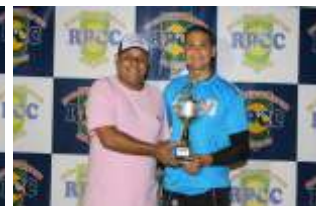
DEFESA MENOS VAZADA - 8 GOLS OS PERIQUITOS/ PERSONAL /MP SPORT'S / SOPRANO CONTABILIDADE