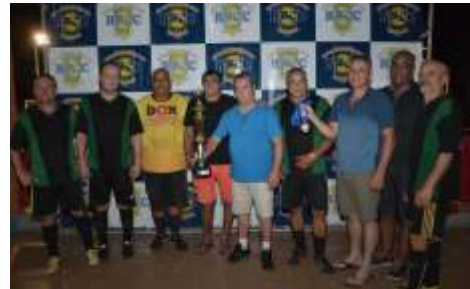
EQUIPE - VICE CAMPEÃ BUFFET COQUEIRO