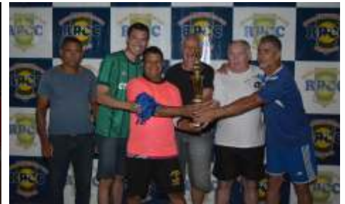
EQUIPE - 3º COLOCADA OS INTOCÁVEIS - BUFFET COQUEIRO