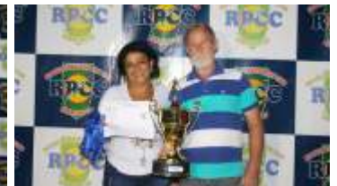
EQUIPE 4º COLOCADA - AMIGOS DA CRISTINA/ CIA DO ESPORTE/ ASSISTEC/ MOREIRA GÁS/ FARMÁCIA SÃO FRANCISCO/ RM SOS DOS OCULOS