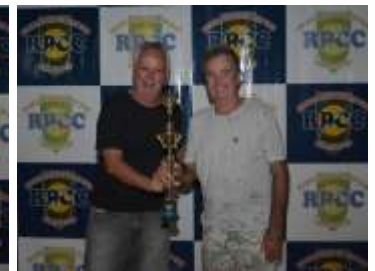
DESTAQUE - TUFFI M.A. REFRIGERAÇÃO - MESSIAS PISCINAS