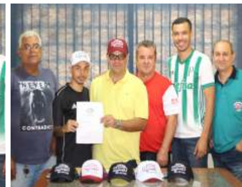
CIA DO ESPORTE - ENTREGA PRÊMIO AO 2º COLOCADO