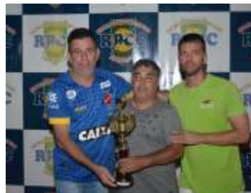
DEFESA MENOS VAZADA M.A. REFRIGERAÇÃO - MESSIAS PISCINAS