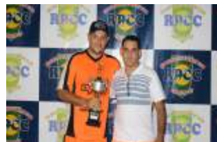
ARTILHEIRO - 9 GOLS - RENATO CIA DO ESPORTE /DIVA MÓVEIS/ VIAÇÃO RIO GRANDE/IMPERADOR DOS SONHOS