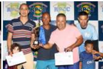
3º lugar JG Auto Center/Cia do Esporte Diva Móveis/CR7 Gesso/Moreira Gás