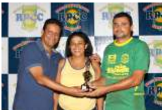
Defesa Menos Vazada Amigos da Cristina Mauricinho Escapamentos Assistec/Farmácia São Francisco