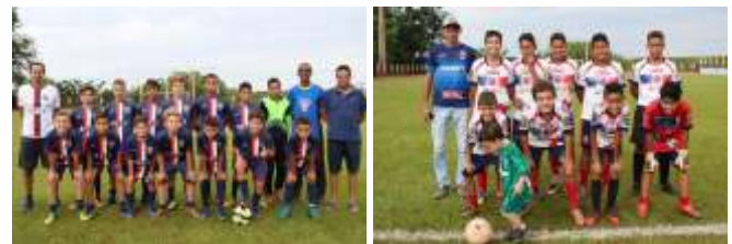
3º Lugar Rio das Pedras Country Club