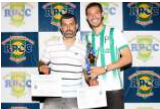
4º lugar Amigos do Guaraná/ Web Rádio Barretos