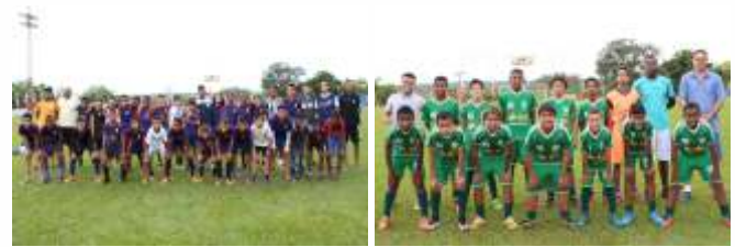
1º lugar Associação Amigos do Bem