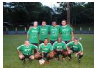
4º Lugar - Equipe Dourado