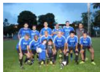
Vice campeão - Equipe Azul Escuro

A classificação do campeonato é a seguinte: