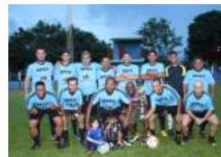
Campeão - Equipe Azul Claro

O campeonato teve início em 1º de novembro e contou com oito equipes inscritas que se revezaram em seis partidas. A final teve início às 19h30 com a disputa do terceiro e quarto lugares e o Amarelo derrotou o Dourado de goleada por 8 x 2.