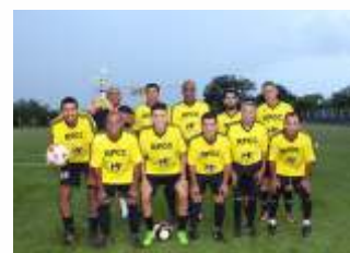
3º Lugar - Equipe Amarelo