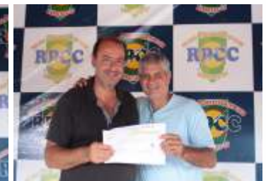
3º Sorteado - 1 Final de Semana Chalé Alle dos Santos Amed